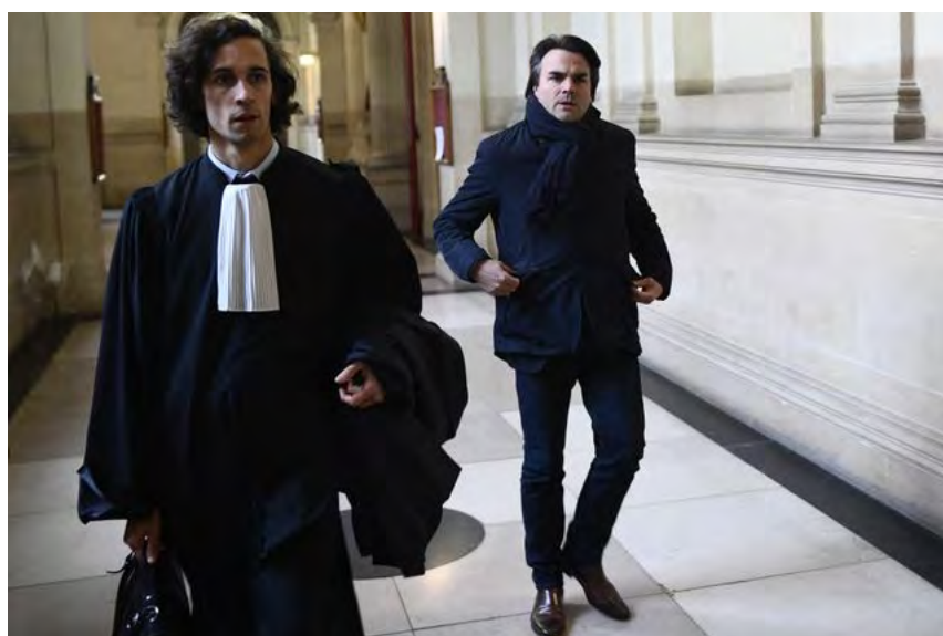
Thomas Thévenoud a été condamné en appel à 12 mois de prison et trois ans d'inéligibilité pour fraude fiscale le 31 janvier dernier.

Célèbre pour avoir quitté le gouvernement quelques jours à peine après sa nomination, le secrétaire d'État Thomas Thévenoud a déposé à l'INPI le 12 septembre 2014 la marque "phobie administrative", sa ligne de défense pour justifier des accusations de fraude fiscale.